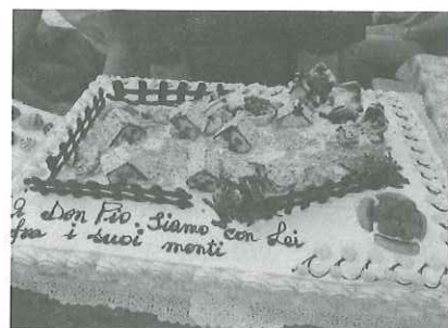
Nelle foto, il gruppo alfonsoinese a San Vito e la torta a ricordo di don Pio Dalle Fabbriche

Quindi, a fine agosto, una folta delegazione alfonsoinese è salita in Cadore, a San Vito, per il ricordo di don Pio Dalle Fabbriche a dieci anni dalla scomparsa: e nel campeggio voluto da don Pio, che oggi porta il suo nome, si è fatta una giornata di festa. Infine, ai primi di settembre, l'ultima "spedizione": nella cittadina pugliese di Toritto, in occasione della Festa patronale.