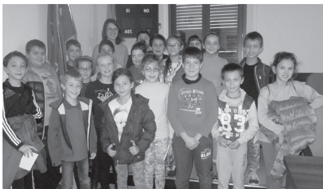
nella foto, la Consulta dei Ragazzi

Si sono insediate le Consulte dei Ragazzi e degli Adolescenti