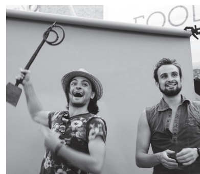
nella foto, i secondi classificati

Il progetto è stato ideato dal Servizio turismo dell'Unione dei Comuni della Bassa Romagna e realizzato in collaborazione con la giovane società 3Pix Studio di Fusignano. Ha contribuito a determinare il successo dell'iniziativa la collaborazione con i Servizi comunicazione e Politiche giovanili dell'Unione e si è rivelato fondamentale l'intervento di Radio Sonora, con le interviste ai partecipanti e la cronaca in diretta delle performance.