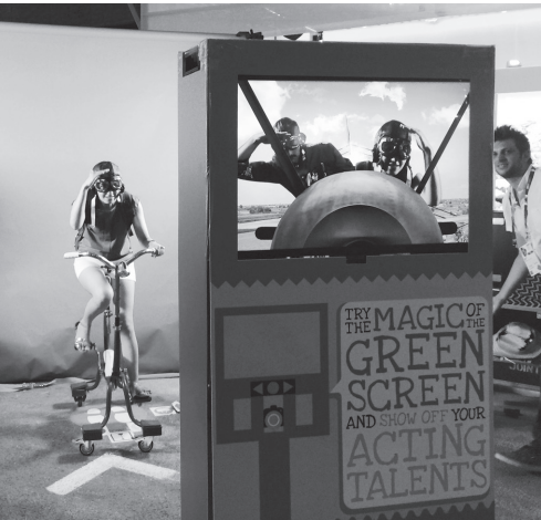
nella foto, la vincitrice del contest sul set allestito all'Expo

Prima classificata una giovane viaggiatrice francese, secondi due fratelli toscani