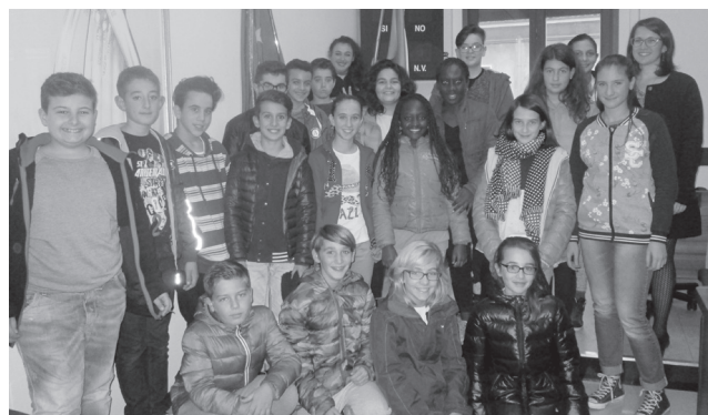
nella foto, la Consulta degli Adolescenti di Alfonsine

Le sedute delle consulte sono sempre tenute dagli educatori