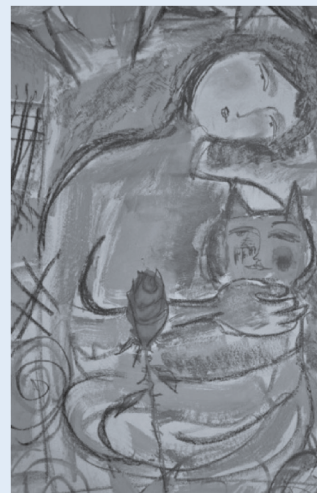
autrice: Ottaviana Foschini

IO TU - NOI - una rosa per dire NO alla violenza