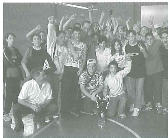
Alcuni dei bei momenti passati dai ragazzi delle scuole durante il gemellaggio dello scorso anno.

La Scuola Media di S. Sofia in visita ad Alfonsine