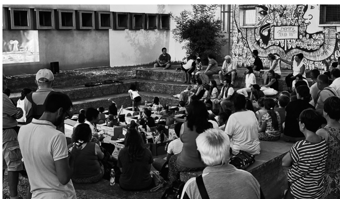
Ricordi d'estate: Il piccolo Drive-in di Menico