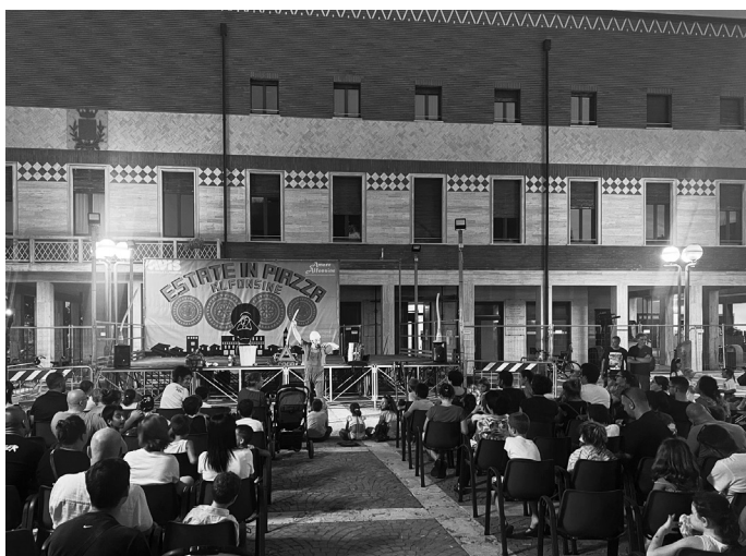
Ricordi d'estate: Urrà! Alfonsine in piazza impazza