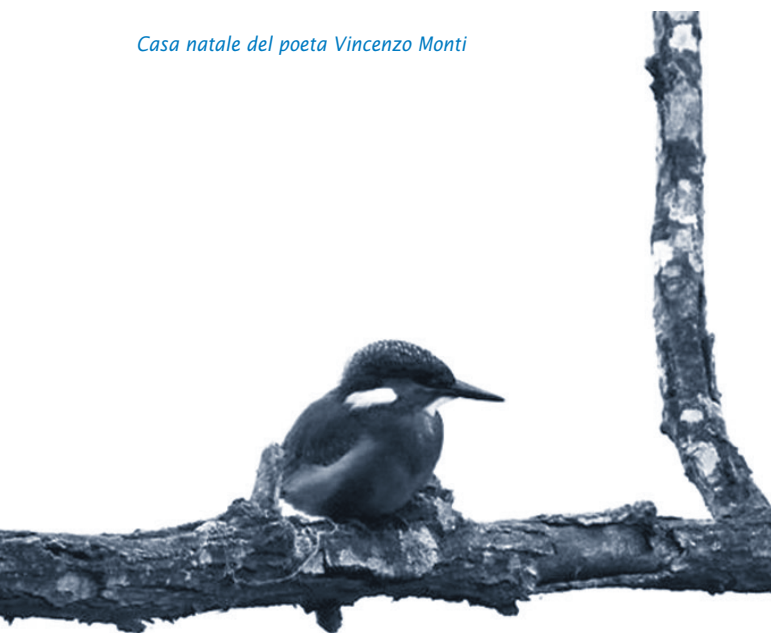
Colias crocea e Martin pescatore alla Riserva Naturale di Alfonsine

Dopo i primi appuntamenti della "Primavera a Casa Monti", dedicati alla poesia e al risparmio energetico e delle risorse, seguiranno due serate: