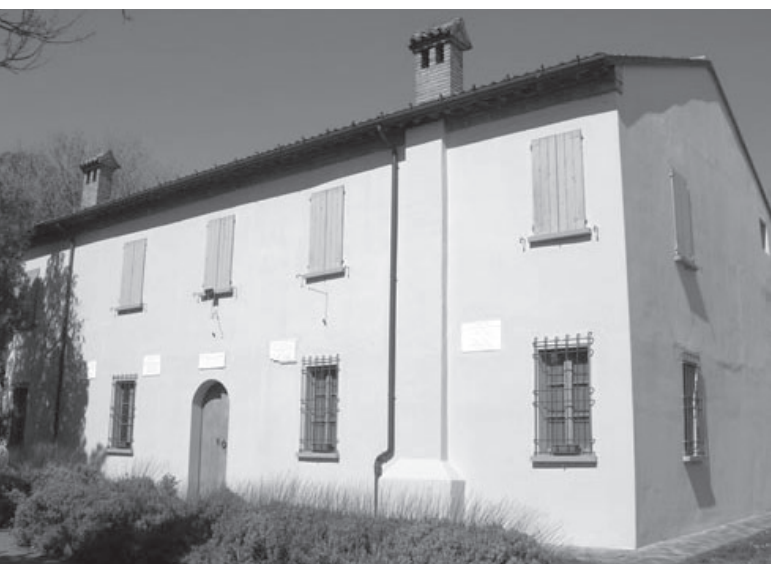
Casa natale del poeta Vincenzo Monti

Ad Alfonsine è partita la rassegna "Primavera a Casa Monti"