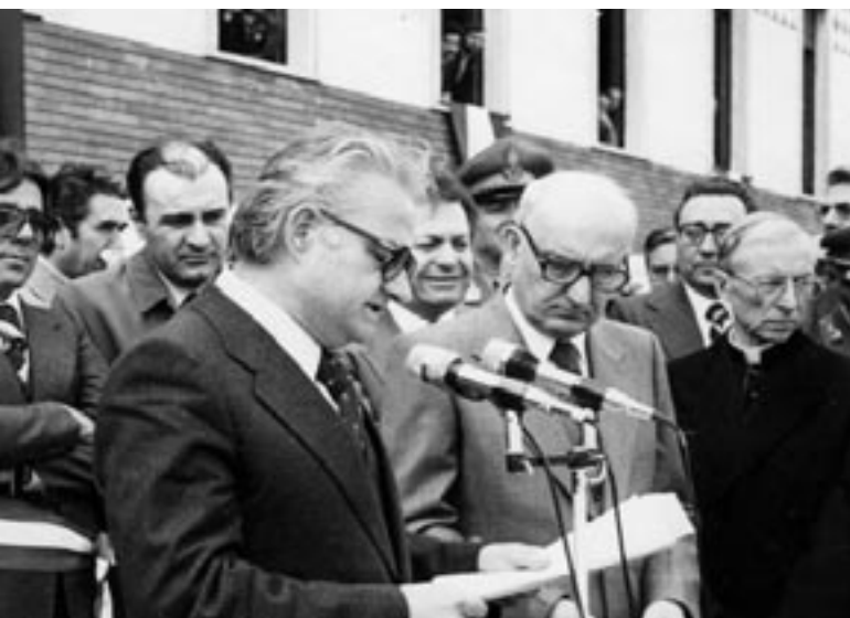
Alfonsine, 10 aprile 1977