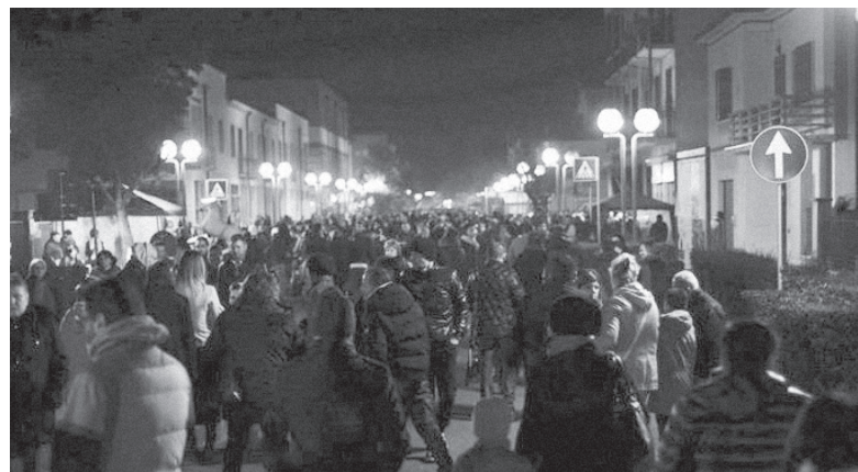
nelle foto, alcune suggestive immagini di Halloween ad Alfonsine 2014

Restate informati consultando il sito www.comune.alfonsine.ra.it nelle pagine riservate agli eventi oppure chiamate lo 0544 866667 o scrivete a segantis@comune.alfonsine.ra.it