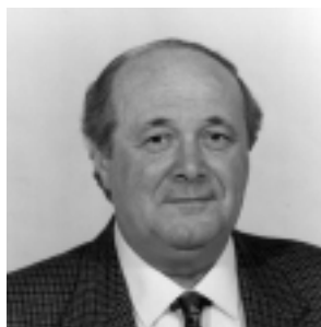
In Consiglio Comunale:

I cittadini alfonsinesi che percorrono tale via, oltre al pericolo rappresentato dall'innesto con la SS16, dovranno continuare a fare i conti con le betoniere e gli autoarticolati che continueranno a imperversare impunemente per via Bruno.