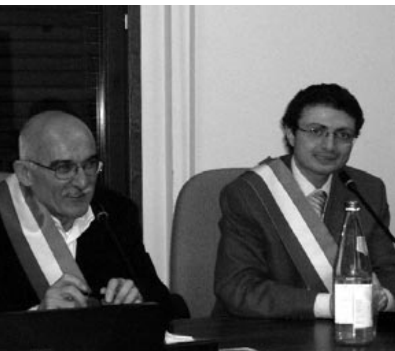
Nella foto, i Sindaci delle due città firmano il Patto di Amicizia.

E' stato ufficializzato il Patto di Amicizia tra Alfonsine e la città pugliese