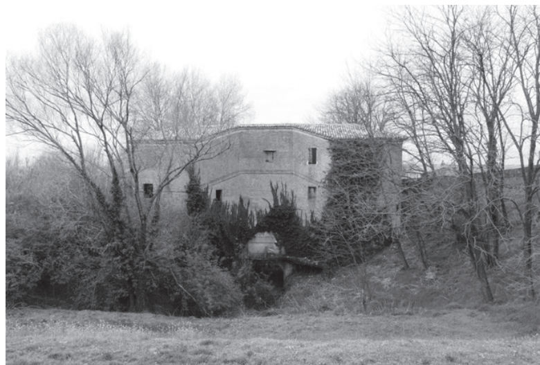
nella fotografia di Luciano Cavassa: l'edificio del Chiavicone nella Fascia boscata del canale dei Mulini

Ai bambini delle scuole primarie di Alfonsine, sarà inoltre dedicata in anteprima mercoledì 14 maggio, una giornata alla scoperta della Riserva Naturale di Alfonsine Stazione n. 1, presso lo stagno della Fornace Violani: "Due passi in Natura" nell'ambito del programma "La Romagna in cammino verso il 2019" promosso da "Ravenna 2019 Città Candidata Capitale Europea della Cultura".