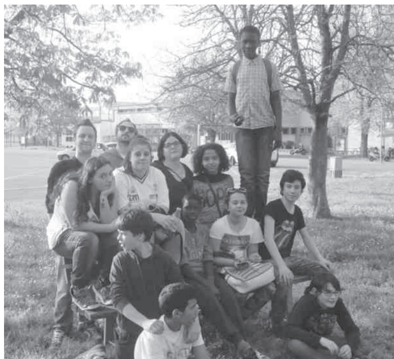
foto in alto: il gruppo dei giovani fotografi (assieme agli educatori del Free To Fly) durante la loro escursione fotografica per la città

Ne è uscito un volumetto di immagini distribuito alla Sagra delle Alfonsine, nonché una mostra fotografica, con molti più scatti, relativi anche al backstage, ovvero ai lavori preparatori: la mostra sarà allestita durante la Sagra delle Alfonsine nell'area giovani in Corso Matteotti, con un momento inaugurale nel pomeriggio di giovedì 15 maggio.