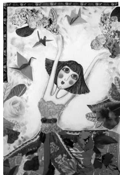
in copertina e pagine interne disegni di Angela Zini