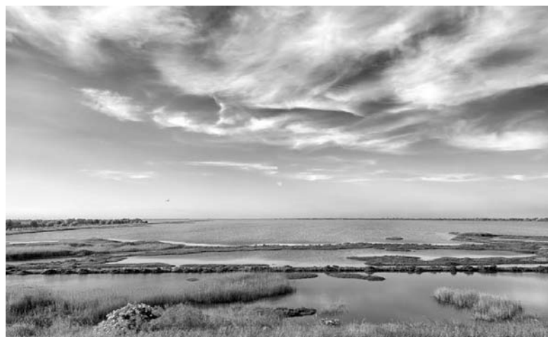
a sinistra, quadro di Graziella Amadori; a destra, fotografia di Geri Bacchilega

Il 20 settembre Alfonsine offre una bella occasione per ammirare ciò che viene definita una forma d'arte trasversale, un mondo da ammirare, osservare, ascoltare. Più che linguaggi, espressioni, inflessioni, suoni. Come l'essere umano sa creare, trasformando l'idea in poesia.