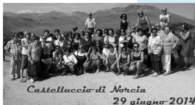
gita della Pubblica Assistenza di Alfonsine

Un grazie di cuore dalla Pubblica Assistenza di Alfonsine a tutti quelli che hanno partecipato!