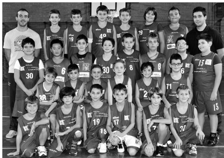
la squadra di minibasket di Alfonsine