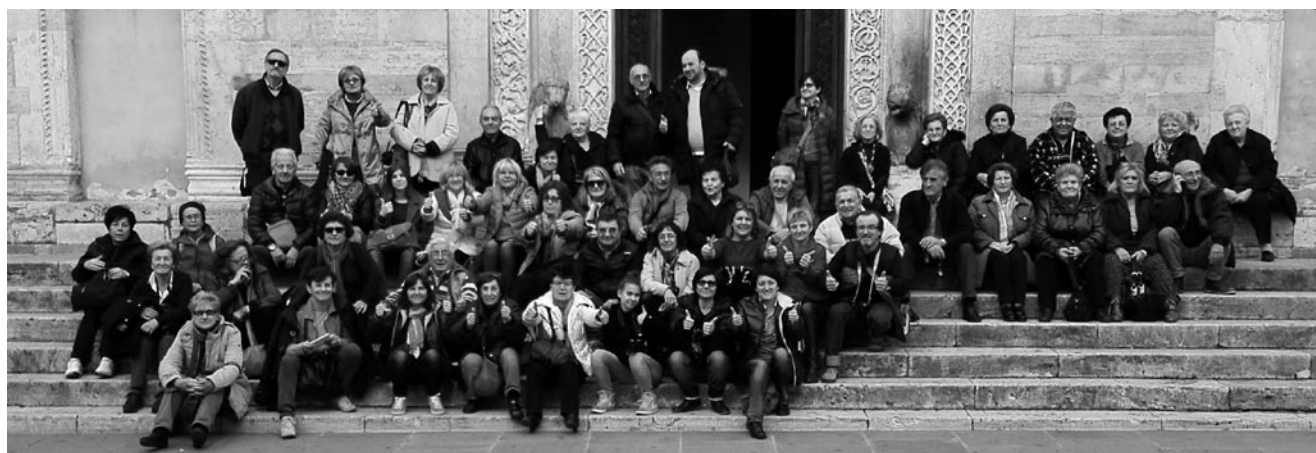
foto di gruppo della gita a Spello

Durante il Consiglio comunale dello scorso 25 novembre, in occasione della Giornata mondiale contro la violenza sulle donne, l'assemblea ha osservato un minuto di silenzio in memoria delle tante vittime del femminicidio (più di 100 dall'inizio dell'anno). Nel corso della seduta del Consiglio, le consigliere e le assessore hanno calzato le ormai evocative 'scarpe rosse', ritratte nella foto, simbolo di una femminilità gioiosa che tutte le donne dovrebbero essere libere di esprimere senza costrizioni o impedimenti, mentre gli uomini presenti hanno mostrato, appuntata al petto, una coccarda rossa per testimoniare un atteggiamento di denuncia nei confronti dell'omicidio di genere.