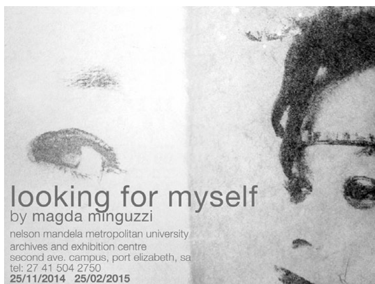
cartolina della exhibition che si terrà a Port Elizabeth

La nostra sede espositiva aveva già ospitato nel 2012 "Le tracce di Magda Minguzzi" ed è con grande soddisfazione che oggi apre le porte per una exhibition in contemporanea con il Sudafrica.