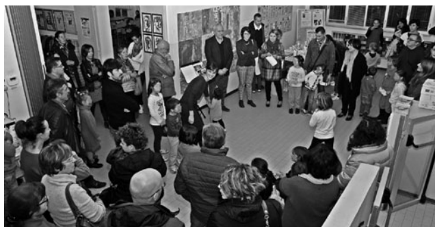
nella foto, un momento dell'inaugurazione de "I 2 Luigi"

foto in alto: un momento della consegna degli "scaffali" di libri donati nell'ambito del progetto "In Vitro" di promozione alla lettura