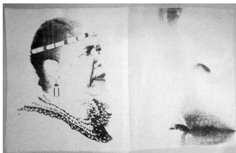
disegno su carta di Magda Minguzzi

La mostra sarà visitabile a Palazzo Marini, ad Alfonsine in Via Roma n. 10, dal 18 dicembre 2014 al 4 gennaio 2015, tutti i giorni, esclusi il lunedì e le giornate di Natale e Capodanno, con orario 15 - 18; l'inaugurazione si terrà giovedì 18 dicembre, alle ore 18.30.