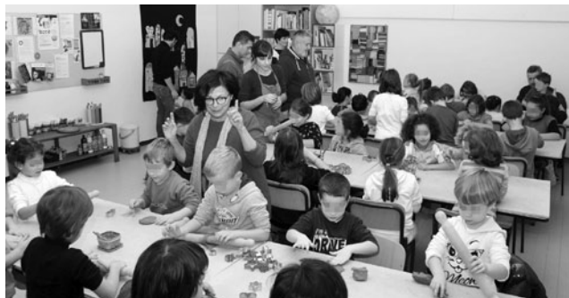
nella foto, i bambini al laboratorio con la creta