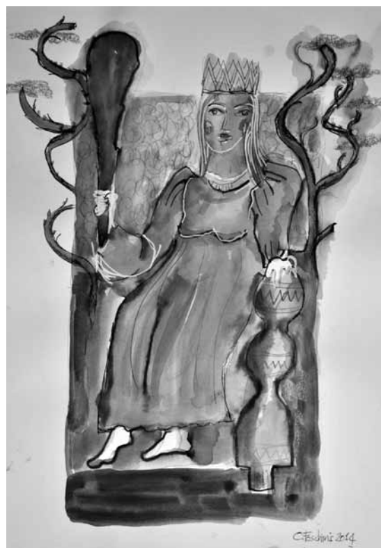
acquarello di Ottaviana Foschini

La mostra "Le stagioni della donna", ospitata nella galleria del Museo della battaglia del Senio (piazza della Resistenza, Alfonsine), sarà inaugurata sabato 8 marzo 2014 alle ore 17 e resterà aperta fino al 30 marzo 2014, tutti i giorni, con orario 10-12 e 15-17.