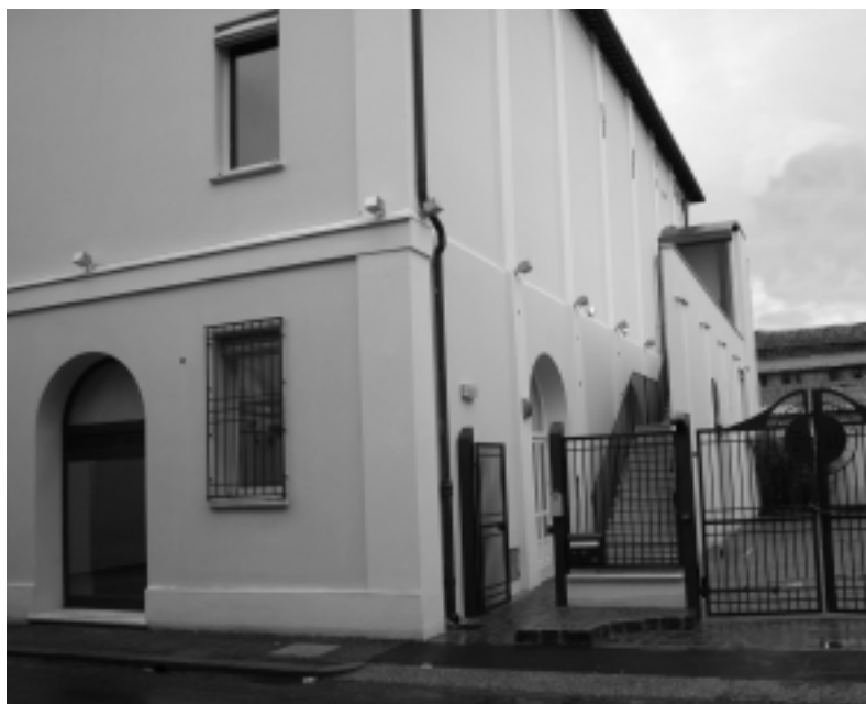
L'entrata a Palazzo Marini in via Roma. In copertina Mattia Moreni, "Autoritratto n. 42: il bambolo del no", 1992.

Sono terminati i lavori di recupero di palazzo Marini. L'edificio storico, donato dalla ditta Marini s.p.a. all'Amministrazione, diventerà un importante centro di promozione culturale e artistica.