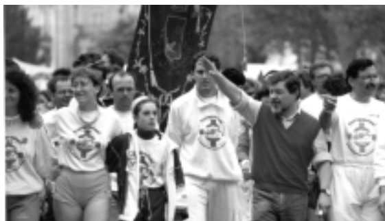
1987: Staffetta Podistica Europaviva, arrivo a Strasburgo al Parlamento Europeo.