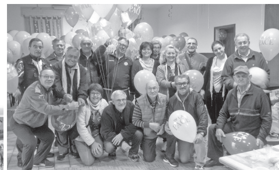
nelle foto, i volontari e gli assistenti civici al lancio dei palloncini

L'Amministrazione Comunale esprime sincera gratitudine a tutti i volontari e gli assistenti civici che in occasione del lancio dei palloncini con messaggi di pace dei bambini delle scuole di Alfonsine, svoltosi il 7 aprile 2016, hanno prestato la loro preziosa collaborazione fin dalla mattina presto per garantire il gonfiaggio di circa 900 palloncini e l'accompagnamento e il supporto alle 35 classi/sezioni partecipanti all'iniziativa. Grazie di cuore!