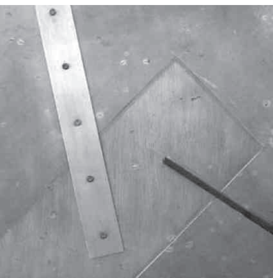
Paesaggio astratto con cerchio, bozza, cm 12x12x1,5, 2005, alluminio, ferro