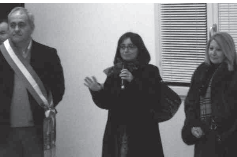
Inaugurazione sala polifunzionale in corso Matteotti

A dicembre, inaugurati il nido del Cerchio e la sala polifunzionale del Bruco. E la grande struttura di via Samaritani sarà messa in vendita