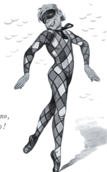
filastrocca e illustrazione su scheda didattica della pubblicazione 'I giorni', anni '70