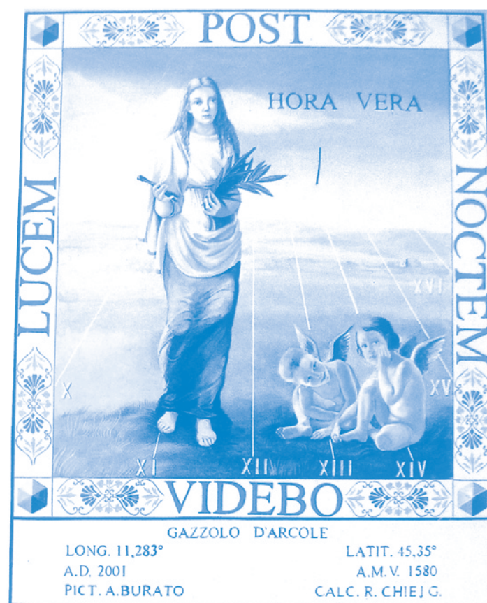
Meridiana di S. Apollonia - Gazzolo D'Arcole (VR) - opera di A. Burato

E dalla festa popolare del Carnevale, ben nota e celebrata a tutte le latitudini, ad una tradizione popolare che invece trova radici profonde proprio nella nostra terra – radici secolari, che si perdono nella notte dei tempi, e che rimandano alla ciclicità delle stagioni così come la si viveva nelle campagne: domenica 24 febbraio il mese delle feste si chiude con la festa di Lom a Merz ,