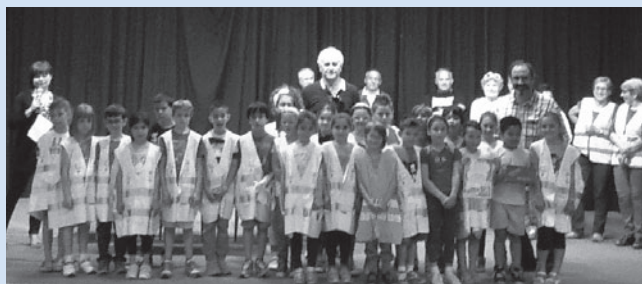
2 a B del plesso "G. Rodari"