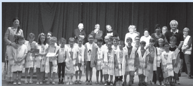
1 a C del plesso "G. Rodari"