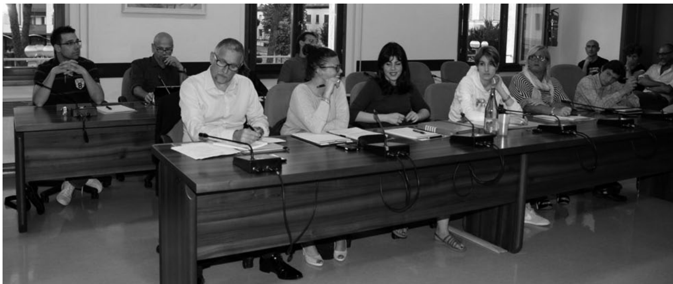
Consiglio comunale del 17 giugno 2014