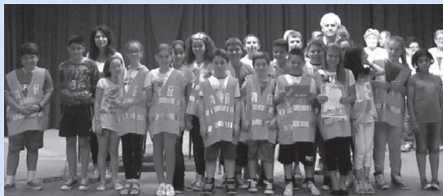
5 a B del plesso "Matteotti"