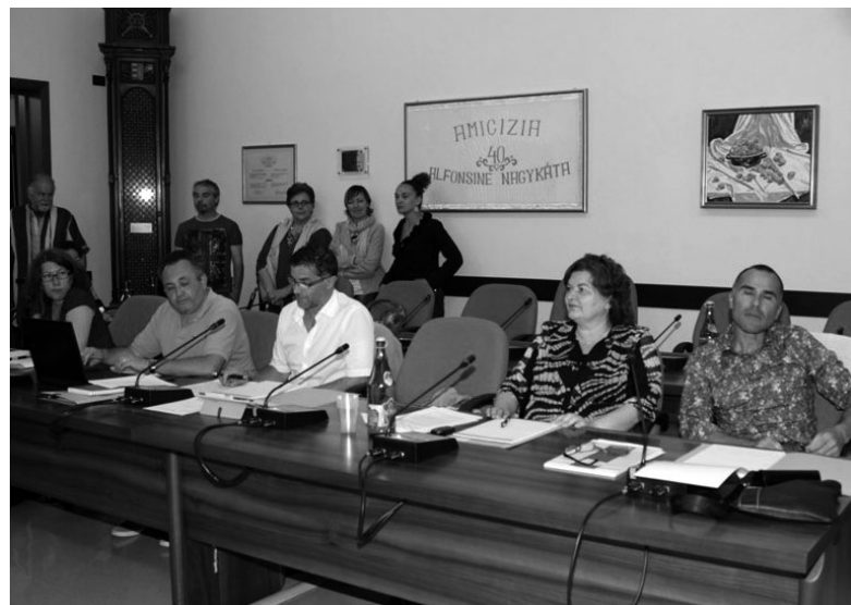
Consiglio comunale del 17 giugno 2014

Infine, mi piacerebbe contribuire ad una maggior percezione del fatto che amministratori e dipendenti pubblici sono al fianco dei Cittadini e cercano, insieme a Loro, di perseguire la crescita della collettività.