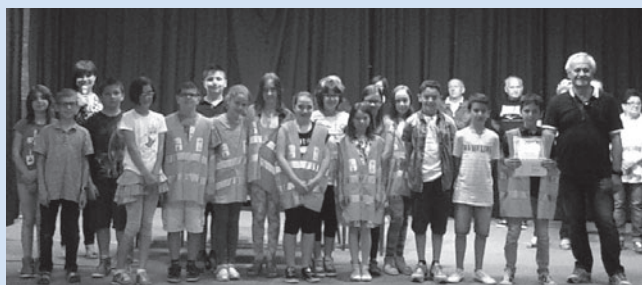
5 a A del plesso "Matteotti"