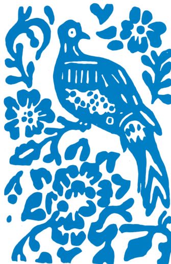
Fagiano tra i fiori, motivo per tendaggi e tovagliati, sec. XIX, Stamperia Marchi Santarcangelo di Romagna