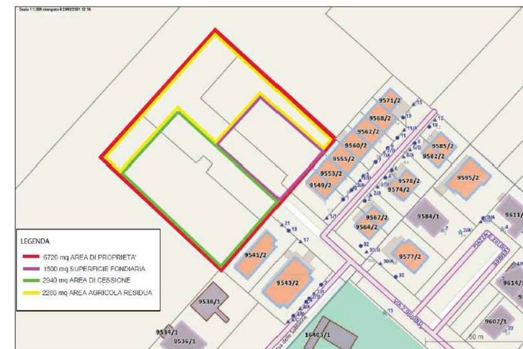
"Schema suddivisione aree" agli atti al prot. 12241 del 23/02/2021