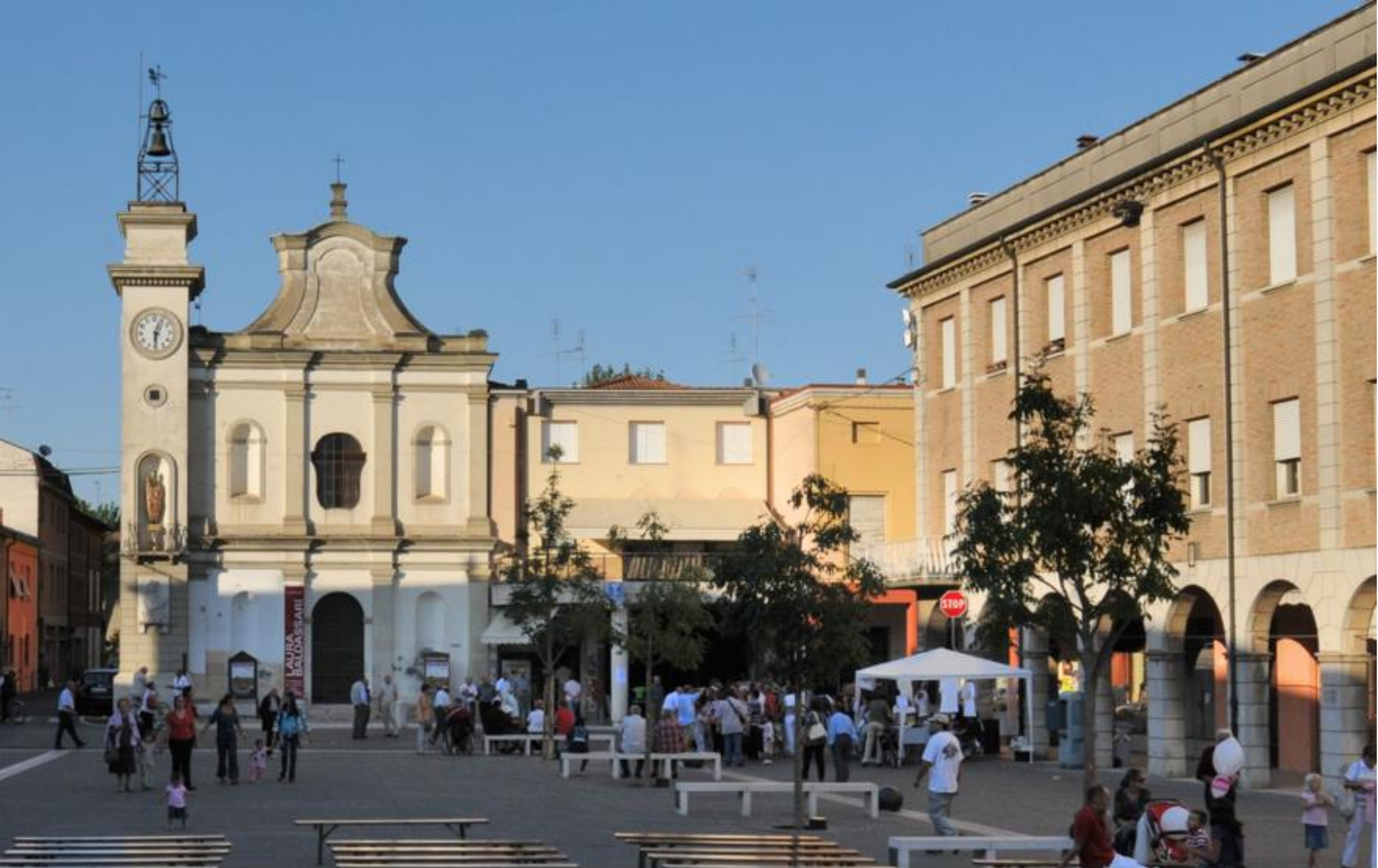
HUB dell'economia urbana di Fusignano Abstract Programma di sviluppo e governance